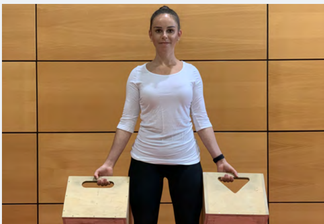
Lasten gleichmäßig verteilen